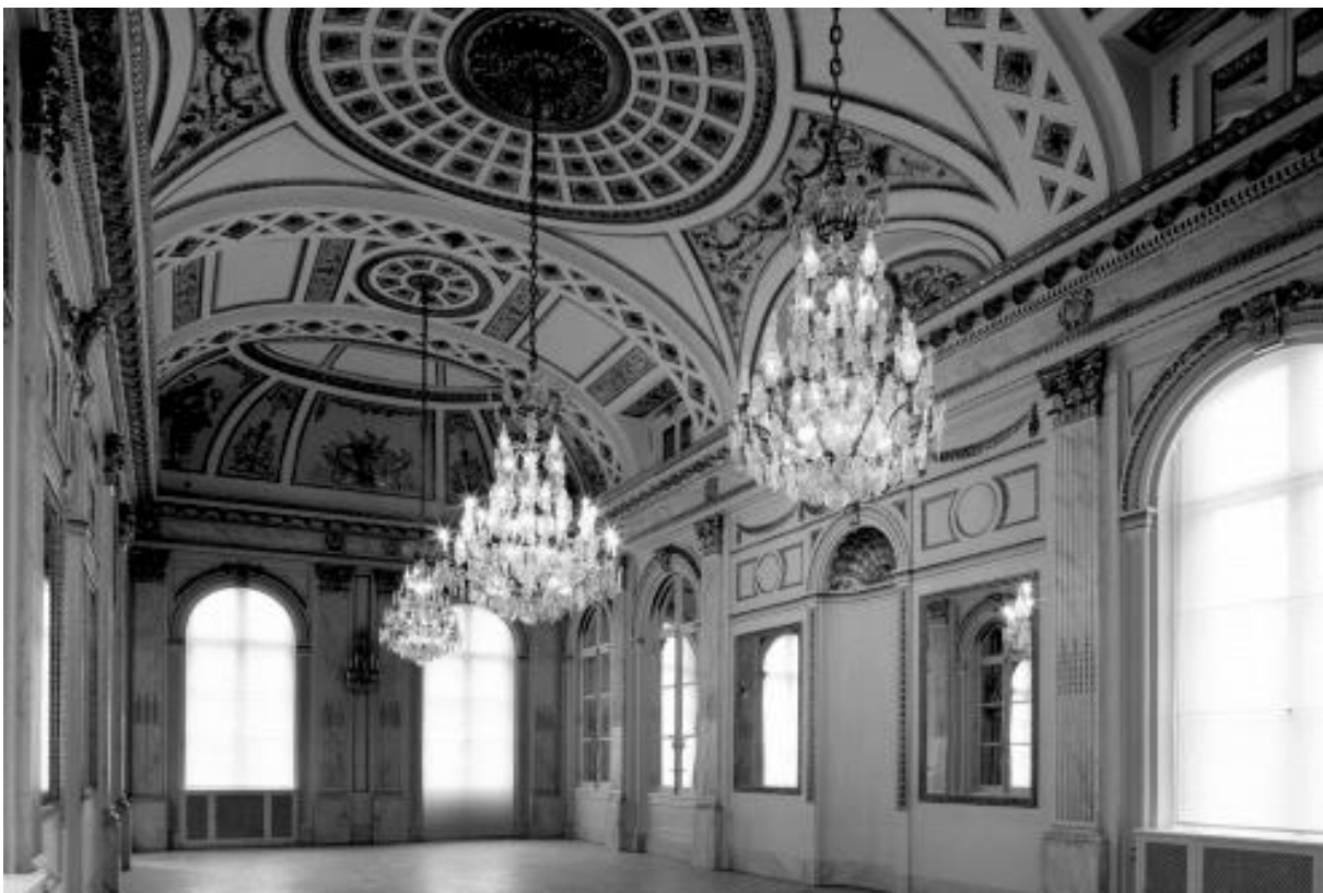
Het Paleis op de Meir, spiegelzaal.