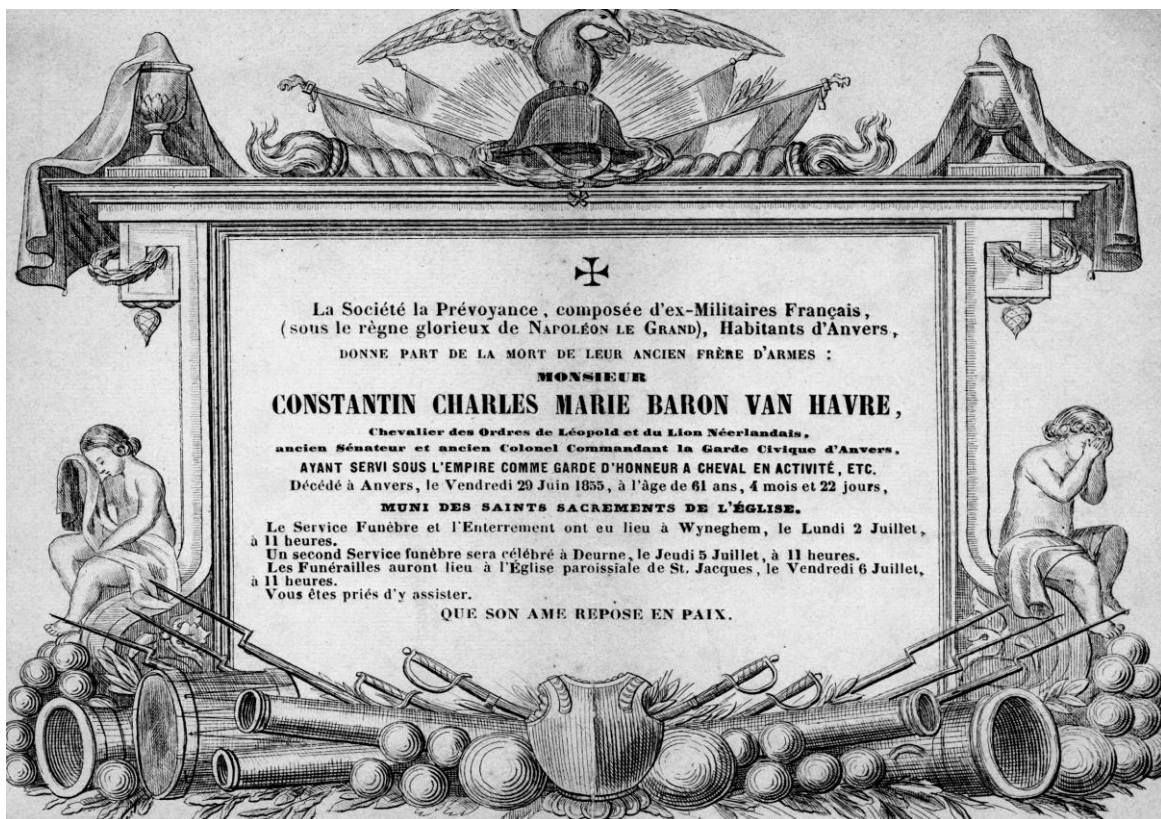
Rouwkaart voor senator ridder Constantin van Havre, verspreid door de maatschappij La Prévoyance, samengesteld uit oudgedienden van Napoleon, 1855.

Doodsbrieven of rouwkaarten maken een overlijden bekend. Het waren edellieden en voorname burgers die in de eerste helft van de negentiende eeuw voor het eerst rouwkaarten en doodsbrieven lieten drukken. De rouwkaarten zijn het oudst. In de eerste helft van de twintigste eeuw namen de gewone burgers dit gebruik over en werd het drukken van rouwbrieven heel gewoon.