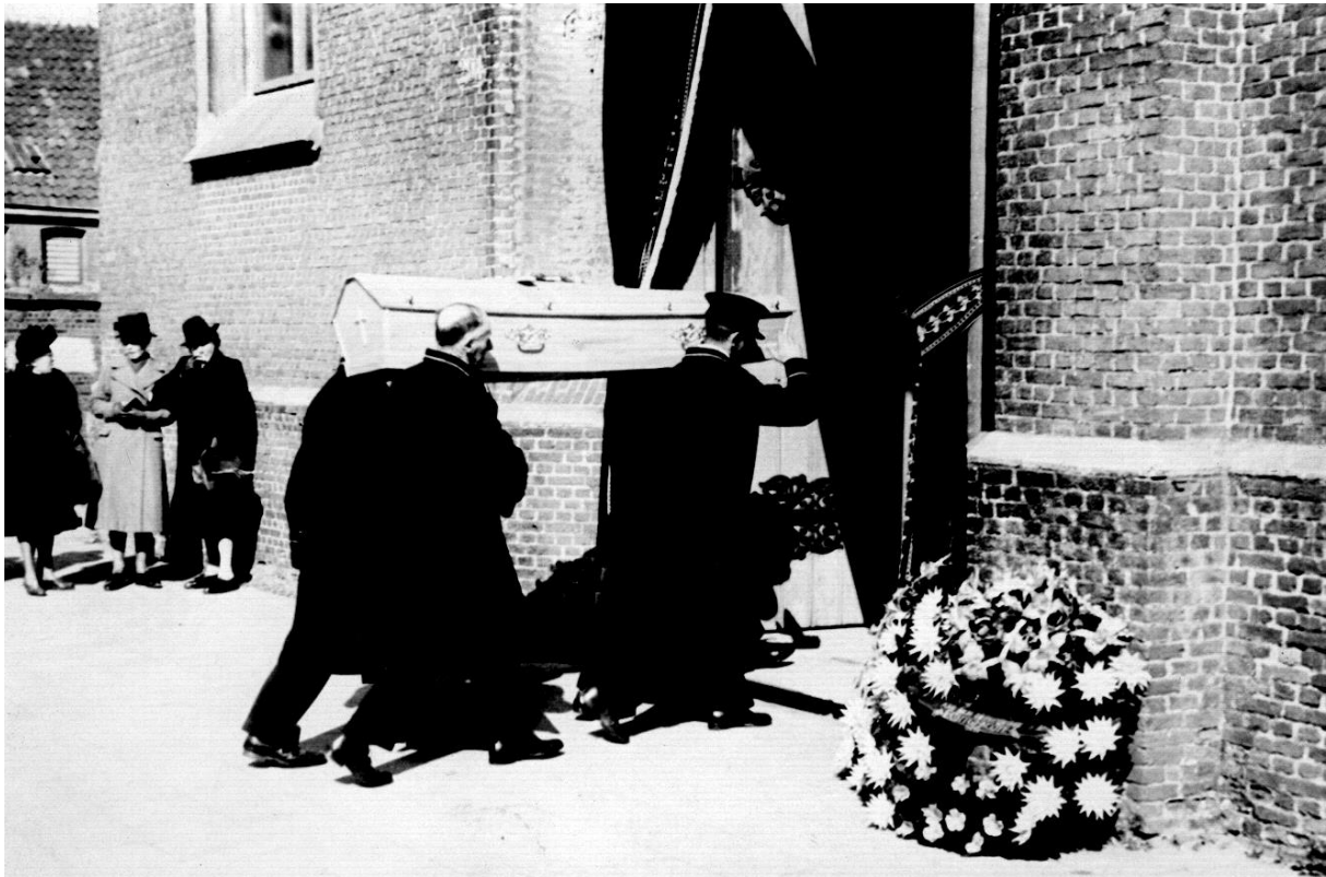
De kist wordt door vier dragers de kerk binnengedragen. De kerkdeur is met een 'portière' omgeven, een teken dat het om een tien- of elfurenlijk ging (1946).

Op de dag van de begrafenis werden de voordeur van het sterfhuis en ook de kerkdeur bekleed met een zogenaamde 'portière', een dubbel zwart gordijn, waarvan beide delen in het midden met een zware stoffen band aan de zijkant van de deur werden vastgemaakt. De doeken mochten de grond net niet raken. Bovenaan werd het geheel afgewerkt met een dwars, onderaan gekarteld doek over de breedte van de deur. Tegen de gevel van het sterfhuis werden ook over de hele breedte zwarte doeken opgehangen.