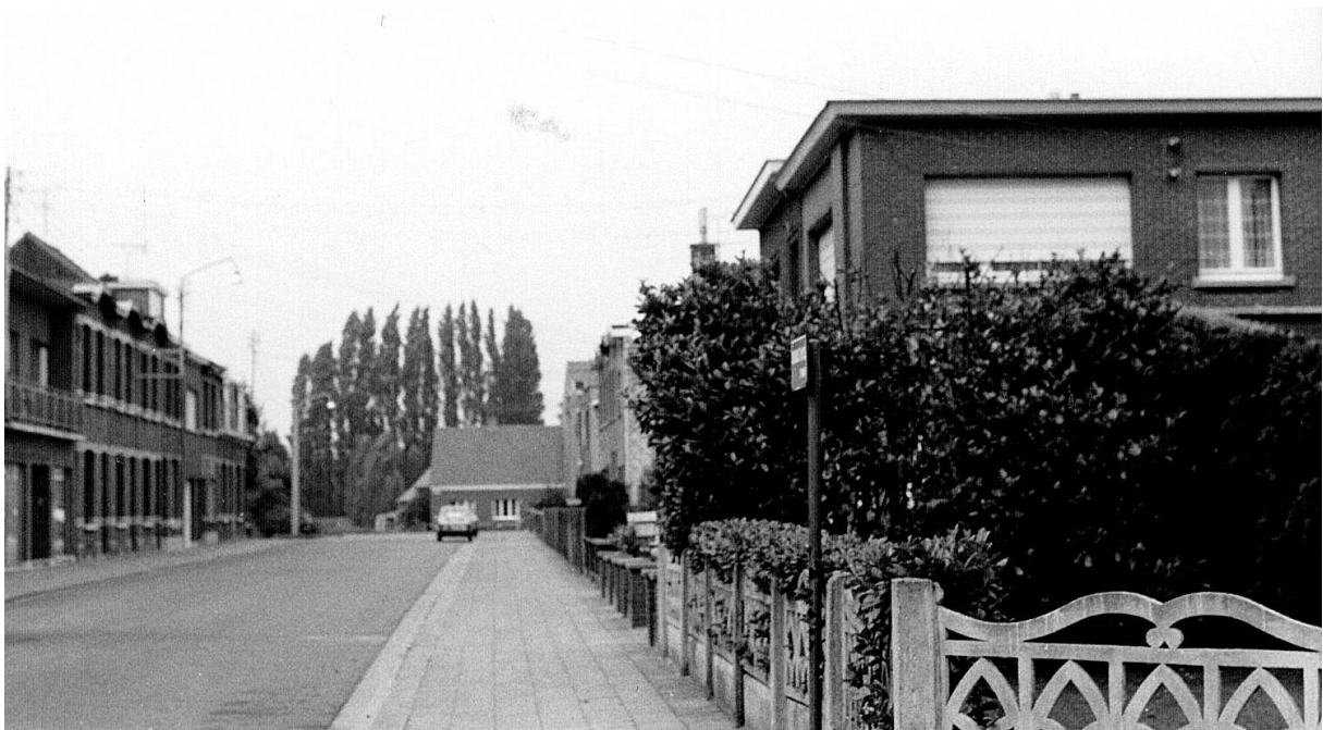
Het oude gasthuis bevond zich rechts achter de geparkeerde auto (foto 1979).

Toen er in 1866 een cholera-epidemie uitbrak, waaraan in België niet minder dan 45.000 mensen stierven, ging de burgemeester bijna dagelijks zijn zieke dorpsgenoten een bezoek brengen om hun zijn morele steun te betuigen. Dit leverde hem en zijn familie voorgoed de sympathie op van de bevolking. Voor deze edelmoe-dige toewijding werd hem trouwens het Burgerkruis eerste klasse toegekend.