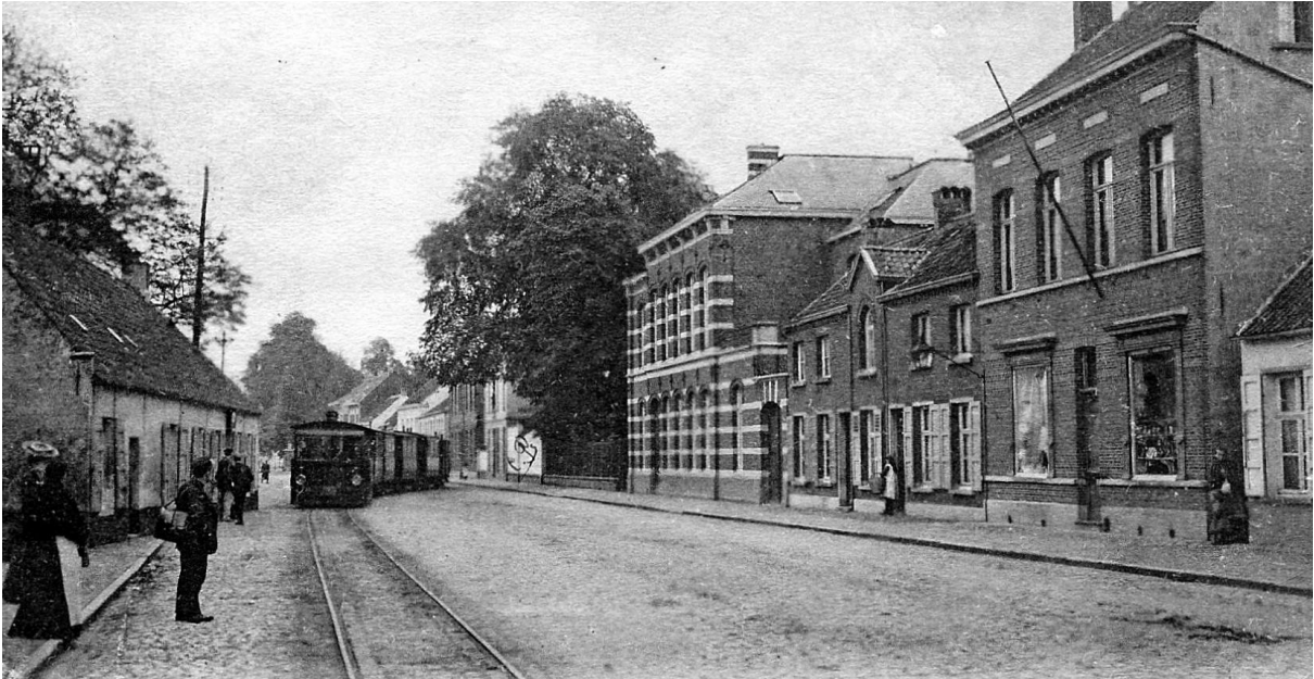
Boven: De stoomtram nam aan het klooster een bocht naar rechts en zette zijn tocht verder aan de noordkant van de Turnhoutsebaan, 1907. - Onder: Een van de laatste trams rijdt op de huidige Dorenboslaan rond het vroegere fort, 1962.

Pas in 1935 liet Antwerpen na lang aandringen toe dat de elektrische tuigen uit Schilde tot in het stadscentrum zouden rijden en zouden keren op de huidige Rooseveltplaats.